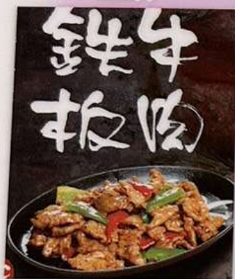
牛肉の鉄板焼き 1180円