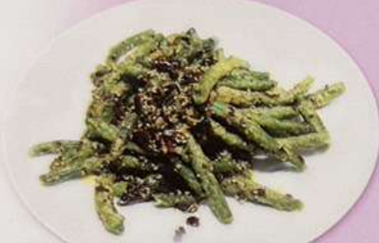
インゲン豆強火炒め 1080円