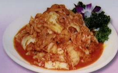
キムチと豚肉炒め (小) 600円 (大) 880円