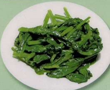
青菜炒め (小) 600円 (大) 880円