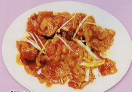
揚げ豚肉の甘酢かけ 1180円