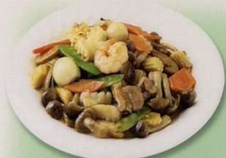
八宝菜 (小) 600円 (大) 880円