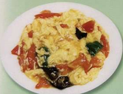
トマト玉子炒め (小) 600円 (大) 880円