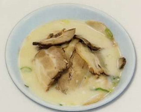
豚骨叉焼ラーメン880円