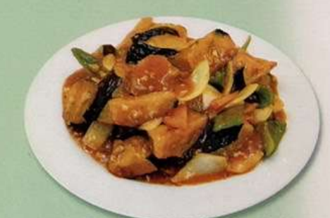
味噌ナス (小) 600円 (大) 880円