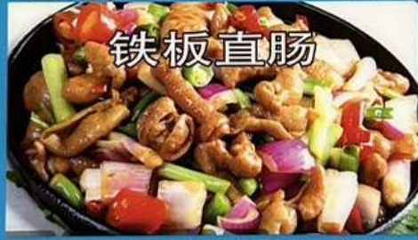
ホルモンの鉄板焼き1180円