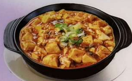
麻婆豆腐 (小) 500円 (大) 780円