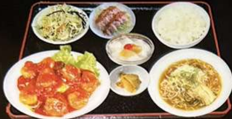
エビチリ定食 1280円 エビマヨ定食 1280円