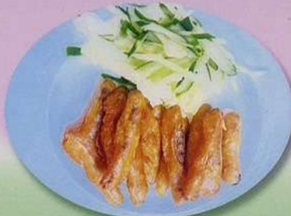
ごぼうの唐揚げ680円