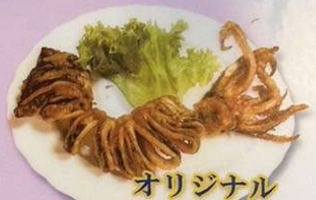
オリジナル イカの唐揚げ(1本) 1180円