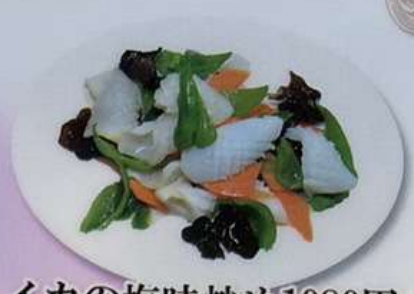
イカの塩味炒め1080円