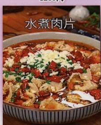
豚肉の四川風煮込み 1180円