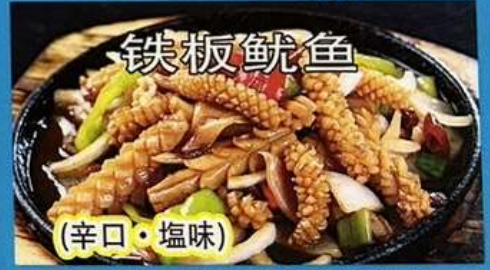
イカの鉄板焼き 1180円