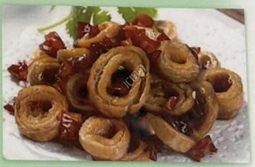
ホルモンの辛子炒め 1180円