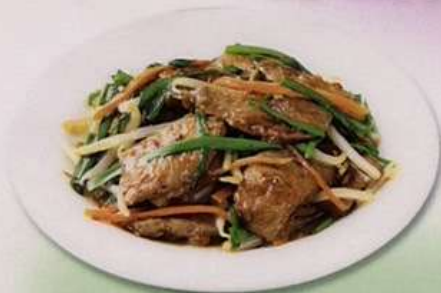
ニラレバ (小) 600円 (大) 880円