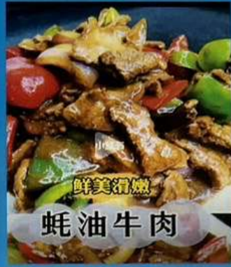
牛肉のオイスターソース炒め 1280円