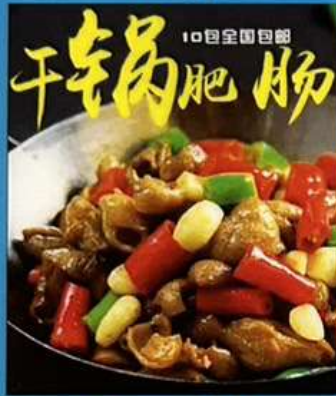
ホルモンの干鍋 1280円