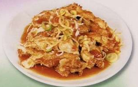
油淋鶏 (小) 580円 (大) 880円