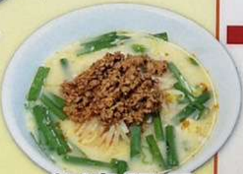
台湾豚骨 ラーメン