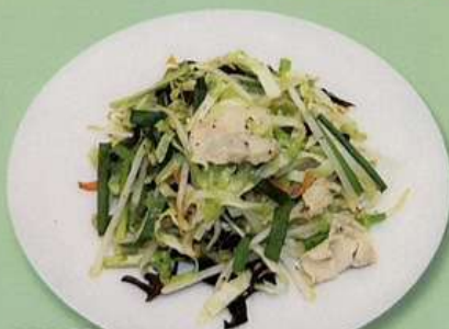
野菜炒め (小) 600円 (大) 880円