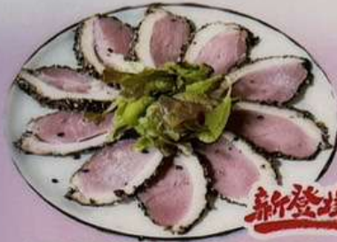
黒胡椒合鴨サラダ 700円