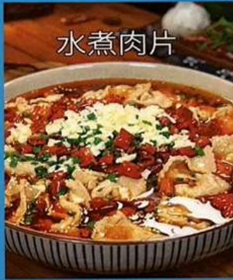
豚肉の四川風煮込み 1180円