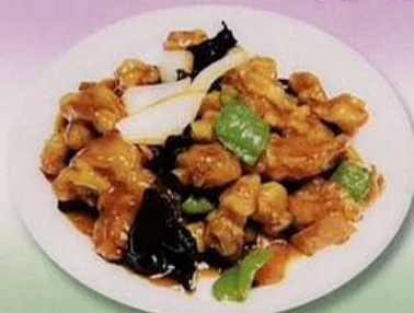
酢豚 (小) 600円 黒酢豚 (大) 880円