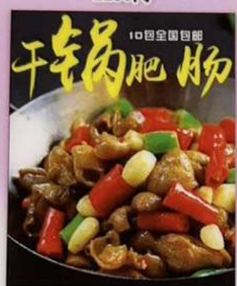
ホルモンの干鍋 1280円