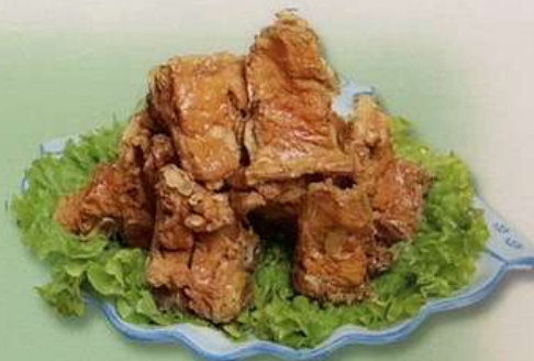
脊骨の醤油煮込み 880円