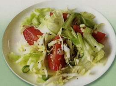
野菜サラダ480円 海鮮野菜サラダ680円