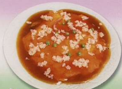
カニ玉子 (小) 600円 (大) 880円