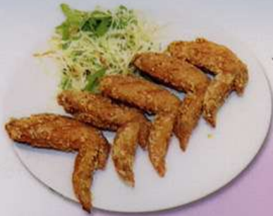
手羽先の唐揚げ700円