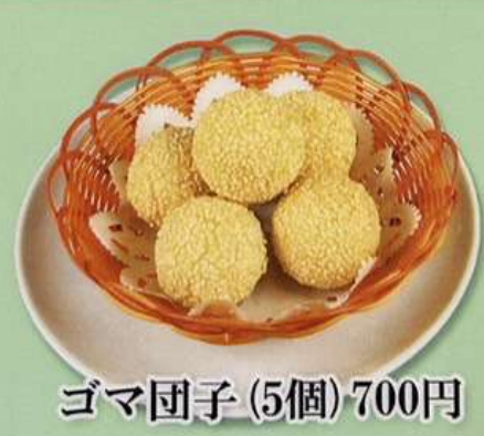
ゴマ団子 (5個) 700円