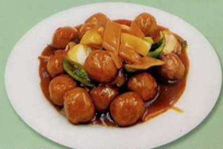
肉団子の甘酢 (大) 880円 黒酢肉団子 (小) 600円