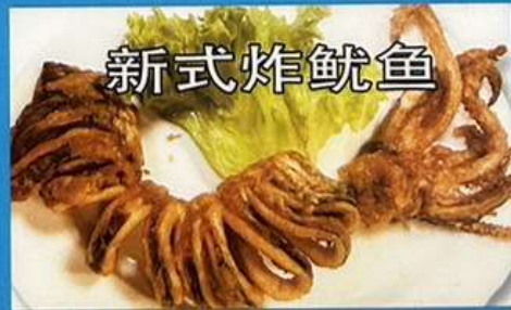
オリジナルイカの唐揚げ 1180円<1本>