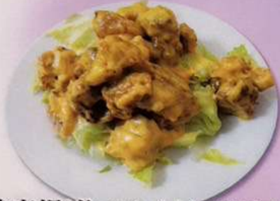
鶏唐揚げマヨ (小) 580円 (大) 880円