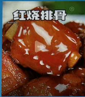
スベアリの醤油煮込み 1180円