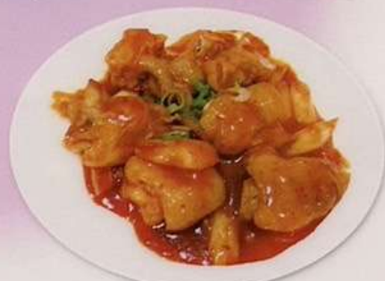
豚足の辛子炒め800円