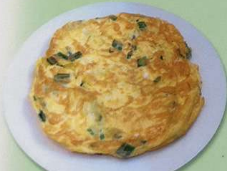
ニラ玉子炒め (小) 600円 (大) 880円