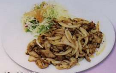
生姜焼き (小) 680円 (大) 880円