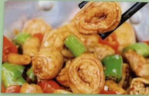
ホルモンの強火炒め 1180円