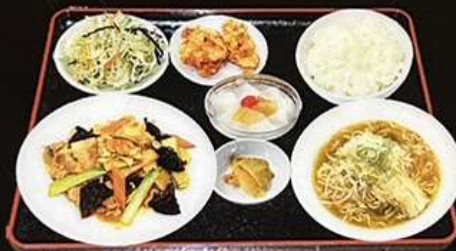
豚肉とキクラゲ炒め定食 1180円