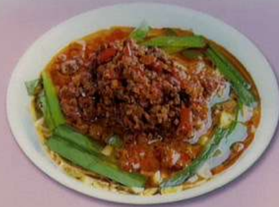
特製台湾ラーメン800円