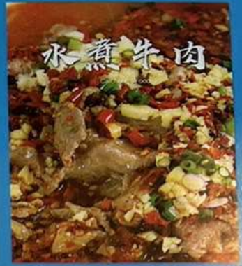
牛肉の四川風煮込み 1380円