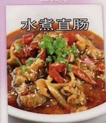
ホルモンの四川風煮込み 1280円