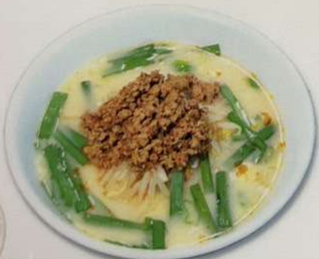
豚骨台湾ラーメン680円