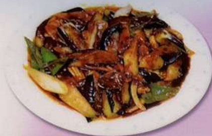
麻婆ナス (小) 600円 (大) 880円