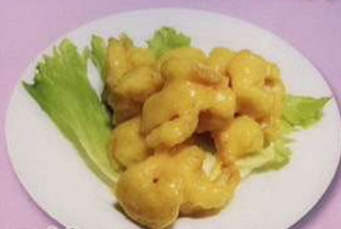
エビマヨ (小) 780円 (大) 1080円