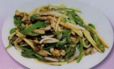
青椒肉絲 (小) 600円 (大) 880円