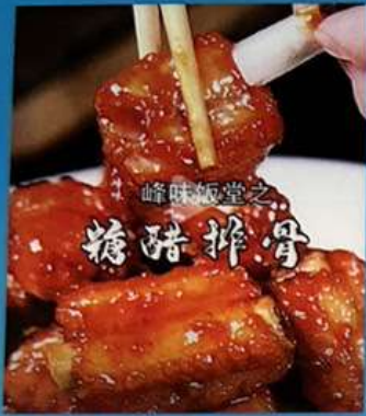
スベアリの甘酢煮込み 1180円