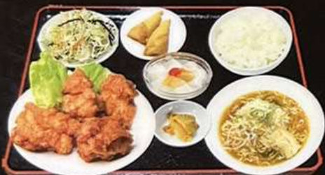
若鶏の唐揚げ定食 1280円 唐揚げマヨ定食 1280円