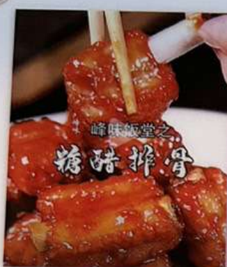
スペアリブの甘酢煮込み 1180円