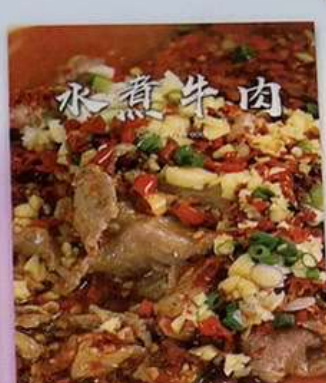
牛肉の四川風煮込み 1380円