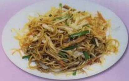
野菜ソース焼きそば 780円