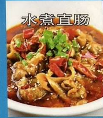
ホルモンの四川風煮込み 1280円