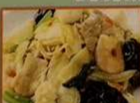
あんかけ焼きそば