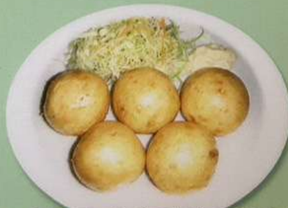
エビ団子(5個)700円 イカ団子(5個)700円