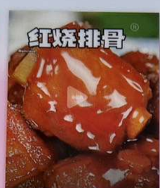
スペアリブの醤油煮込み 1180円