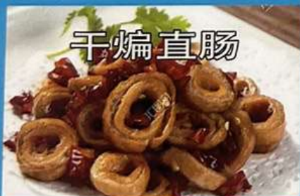
ホルモンの辛子炒め 1180円