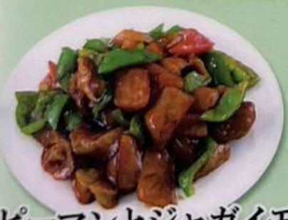
ピーマンとジャガイモ とナス炒め 980円