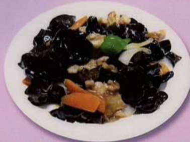
豚肉とキクラゲ炒め (小) 600円 (大) 880円