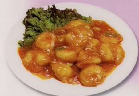
エビチリ (小) 780円 (大) 1080円