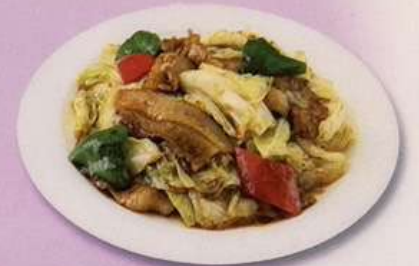
回鍋肉 (小) 600円 (大) 880円