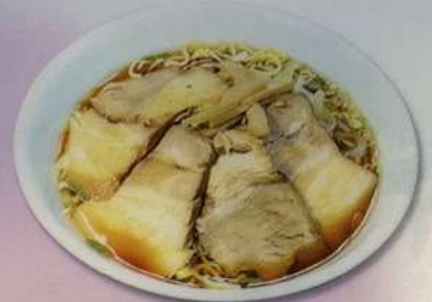
チャーシュー麺880円