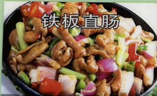
ホルモンの鉄板焼き1180円