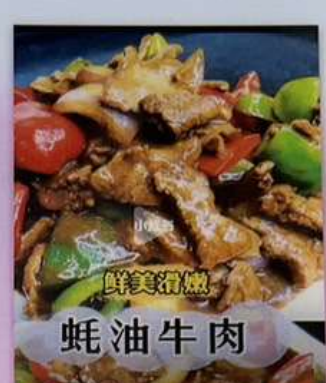
牛肉のオイスターソース炒め 1280円