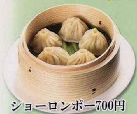
ショーロンポー 700円